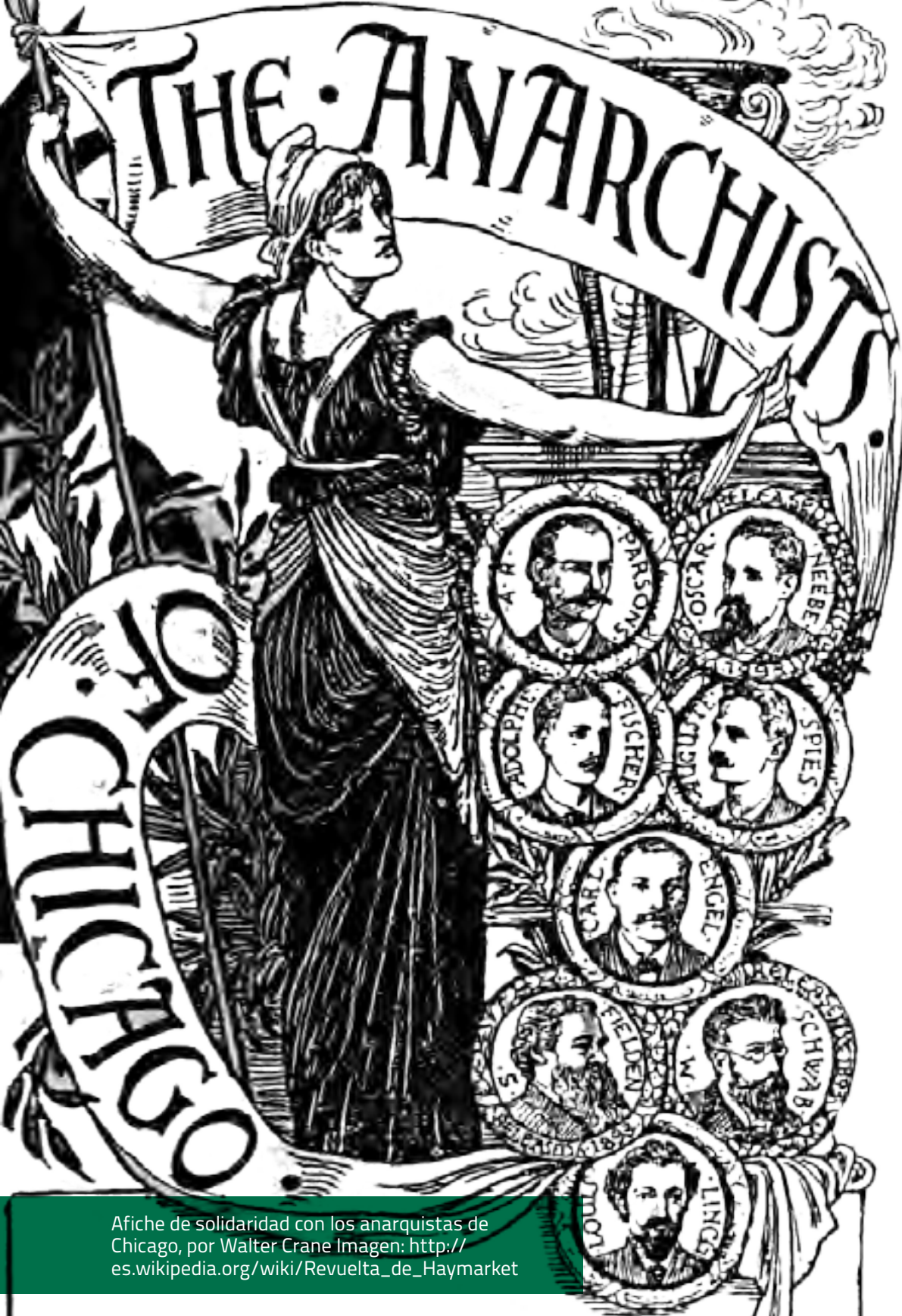
Afiche de solidaridad con los anarquistas de Chicago, por Walter Crane