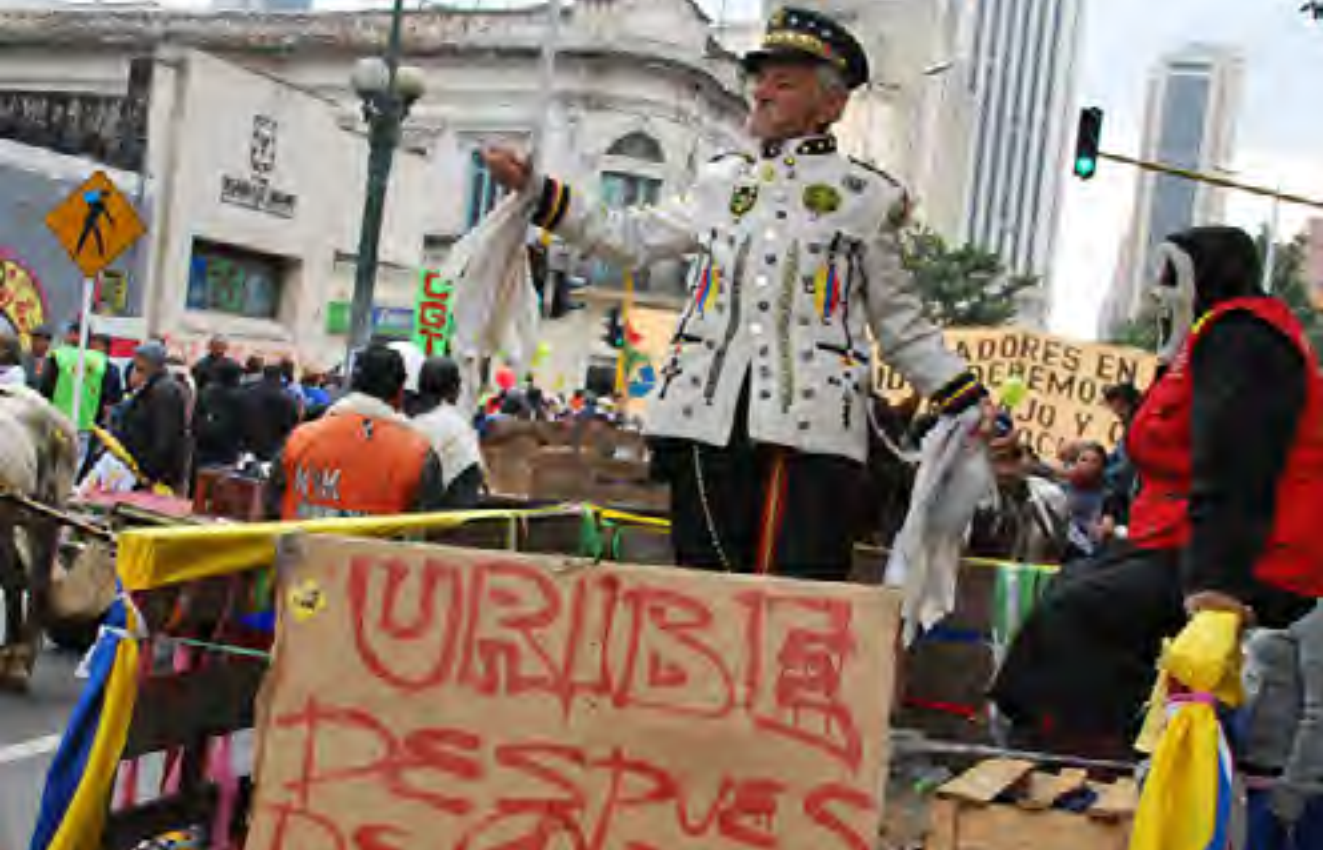
Marcha Primero de Mayo, 2009.

si exceptuamos a los Estados Unidos, y en 2009 representaba el 4% del PIB. ¿Será porque los vendedores de armamento como Dassault o Lagardère, que por cierto también son dueños de imperios mediáticos, prefieren no arriesgarse a perder un mercado muy apetecible?