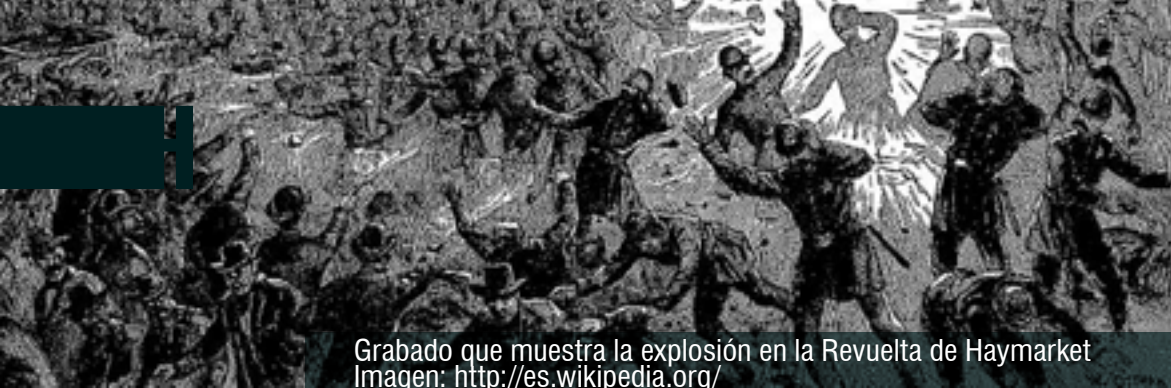
Grabado que muestra la explosión en la Revuelta de Haymarket

En América los nativos inicialmente fueron esclavizados por los conquistadores españoles, portugueses, ingleses, holandeses y franceses. De hecho los prisioneros de guerra y los infieles eran reducidos a la condición de esclavos. Además, en la sociedad hispano-colonial tanto en la metrópoli como en sus dominios la esclavitud era una realidad con amparo legal e institucional. La simultaneidad del indigenismo y el esclavismo como políticas monárquicas constituyen dos aspectos complementarios de la dominación colonial 4 .