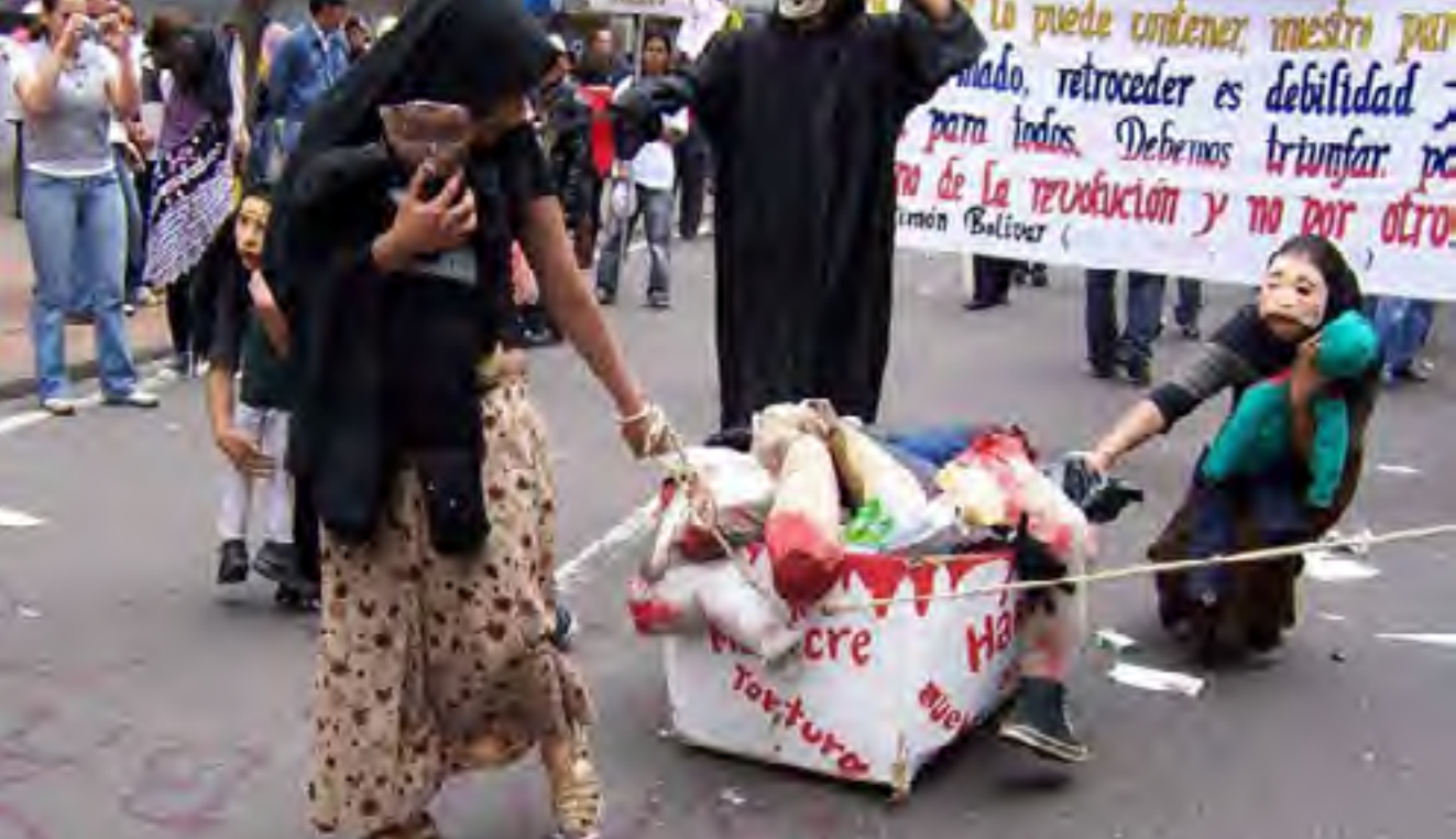
Marcha Primero de Mayo, 2007. Bogotá.

Europa proporcionó a Bizancio y al mundo islámico esclavos en sus territorios, y en el siglo XII hubo esclavos para el cultivo de la caña de azúcar y en la explotación minera en el Mediterráneo, en Chipre y Sicilia. Los holandeses expandieron el tráfico en los más disímiles lugares. Luego los portugueses tuvieron la primacía, después Inglaterra y España. Al igual de lo que sucedió con las comunidades indígenas en África, los intermediarios que capturaban y entregaban a los cautivos eran africanos “notables”.