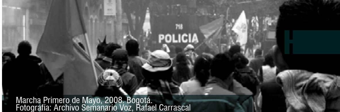
Marcha Primero de Mayo, 2008, Bogotá.

estaban sometidos al biopoder de los mineros, plantadores y en general propietarios esclavistas. Esta relación de explotación y dominación era racial y clasista 7 .