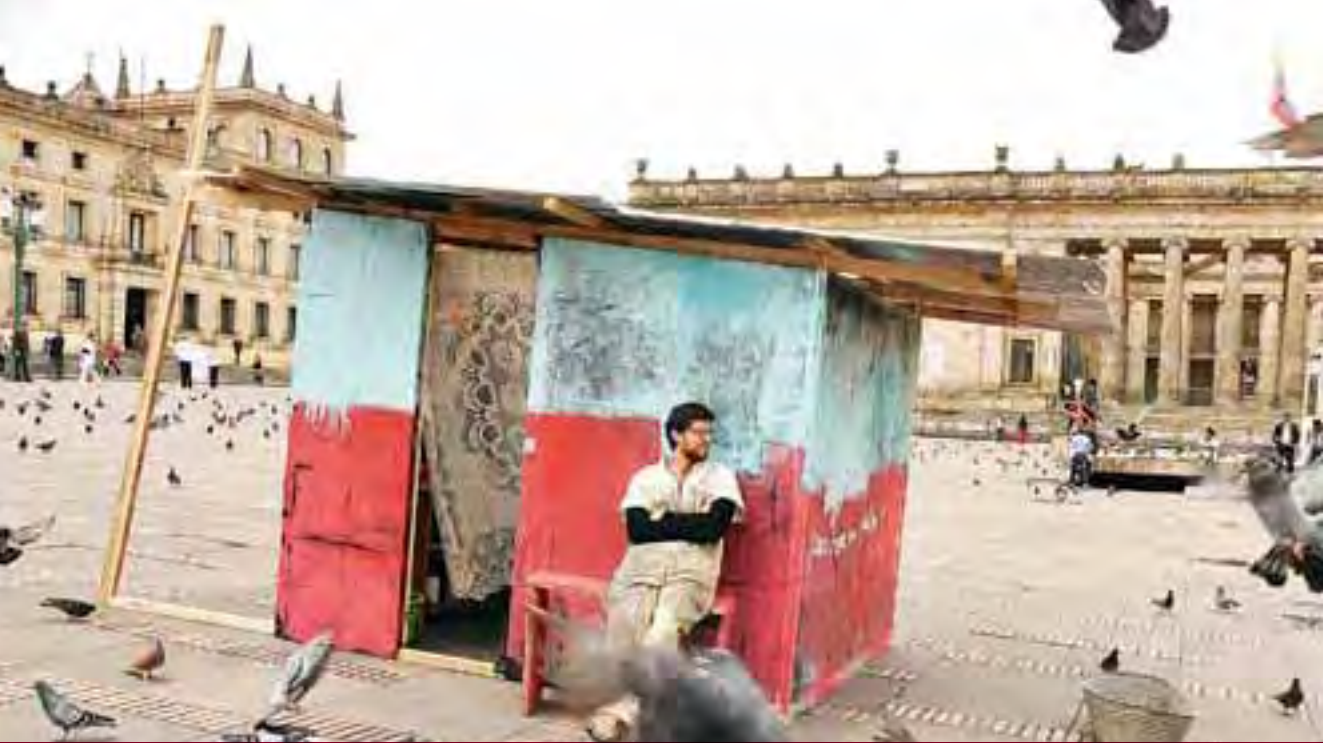
Casa de una lavandera de ropa (2009). Simon Hosie. Autor de la carta que inspiró a Beatriz Gonzalez a continuar su obra sobre Yolanda Izquierdo.

de sentido del actual gobierno y que, en consecuencia, explican el desarrollo de la agenda legislativa. Teniendo como marco de referencia estos presupuestos, este artículo busca mostrar un balance general de las principales leyes y reformas constitucionales que se han dado durante el último año y problematizarlas de cara a los desafíos que éstas le plantean a la superación de los conflictos territoriales que se viven en diversas regiones del país.