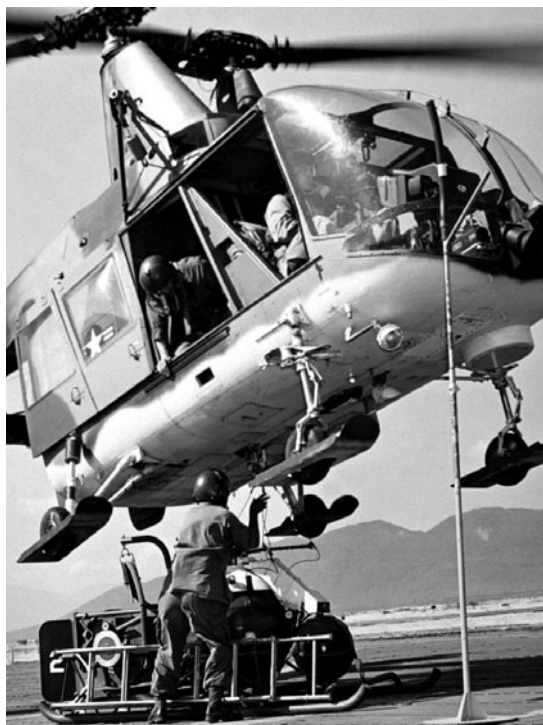
1964. Se llevaron a cabo operaciones militares contra las regiones en las cuales se refugiaron los núcleos guerrilleros comunistas que enfrentaron la brutalidad oficial en el período de La Violencia. Mayo 27 de 1964. Las Fuerzas Militares atacan Marquetalia, pequeño territorio del corregimiento de Gaitania, municipio de Planadas, en el departamento del Tolima.

La insistencia en situar el dilema en la aparente oposición entre guerra y paz, lleva progresivamente a identificar la “paz” con la ausencia de guerra o la supresión del conflicto. Esta noción conceptualmente negativa de paz, como no-guerra, ha sido fuertemente criticada por la tradición teológica y filosófica. Basta recordar el pasaje bíblico de Isaías 54, para quien la paz como opus justitiae exige relaciones de armonía dentro de las comunidades. También los párrafos iniciales de La Paz Perpetua de Kant 1 dan luces para diferenciar los simples armisticios o el aplazamiento de las enemistades de una verdadera paz. Para esta profunda tradición, la mera ausencia de guerra o el fin de un conflicto violento “puede ser compatible con distintas y graves situaciones de injusticia” 2 , por tanto la perpetuación de la injusticia es una forma de violencia social. La perpetuación de ciertas formas de injusticia grave es también motivo para la justificación moral de la guerra o la subversión. La simple consideración de la paz como mera ausencia de guerra, suprime su condición de bien último o superior porque admite la posibilidad de una paz injusta o una paz de los cementerios. En este proceso de indiferenciación, la “paz” termina identificada con