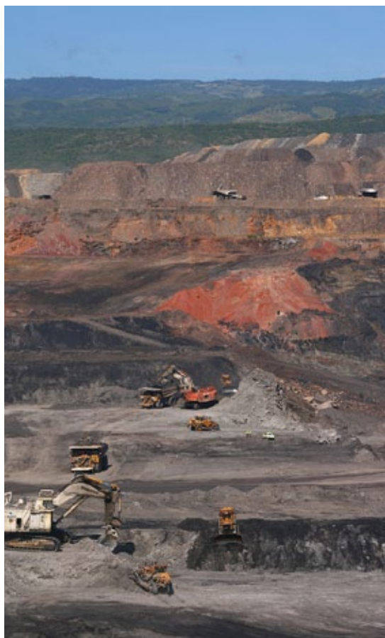
Mina de carbón en el Departamento de La Guajira, Colombia, conocido como el Cerrejón o El Cerrejón. Las características de la mina permiten una extracción a tajo abierto, y es una de las minas más grandes a cielo abierto del mundo. http://www.elpilon.com.co/inicio/wp-content/uploads/2013/03/Mina_de_carb%C3%B3n_en_Estercuel_Arag%C3%B3n1.jpg

¿Qué ocurrió después de la caída del Muro? En el plano estrictamente doméstico, Alemania Federal anexó a la República Democrática Alemana y, menos de un año más tarde, el 3 de octubre de 1990, el canciller Helmut Kohl proclamó la reunificación. Ésta se llevó a cabo con un apenas solapado ánimo de venganza. En los demás países, una vez desaparecida la Unión Soviética, sus pueblos pudieron preservar su identidad nacional. En el caso alemán, en cambio, la reunificación intentó borrar hasta las más insignificantes huellas de la RDA. Como comenta Maxim Leo, un joven periodista que creció en la RDA, «nuestro país dejó de existir y