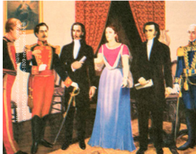
1809. Primera Junta de Gobierno Autónoma creada en el territorio de la Presidencia de Quito a raíz de la invasión napoleónica de España.

Se presentan, inicialmente, los montos porcentajes (por año y en dólares) de los recursos previstos en el Plan Total, según estrategias y objetivos, por parte de las seis fuentes de financiación antes señaladas (Cuadro N.º 1). Posteriormente, se concentra la atención en las dos estrategias concernientes directamente con el proceso de paz: 1. Transformación del Campo (Cuadro N.º 2) y 2. Seguridad, Justicia y Democracia para la construcción de la Paz (Cuadro N.º 3). Cada uno acompañado de algunos comentarios puntuales.