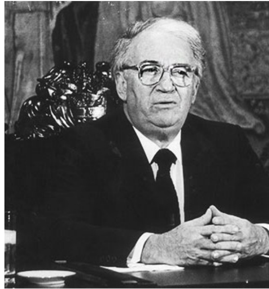
Belisario Betancur, Presidente de la República 1982 - 1986.